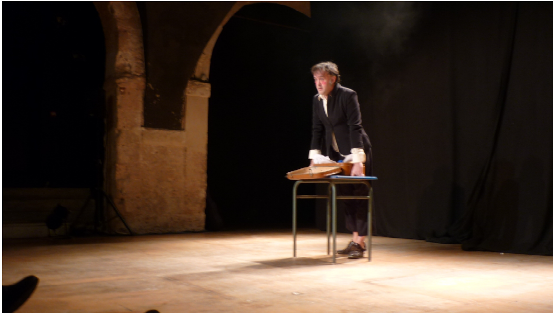
Dakiling à Marseille