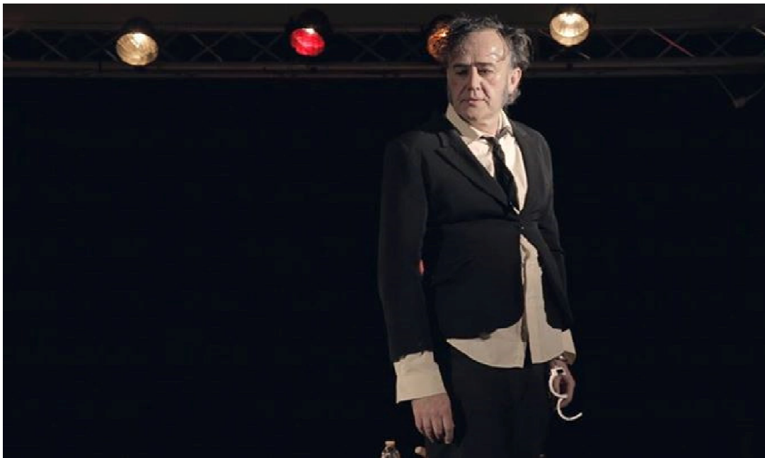
Tous en cirque à Montpellier